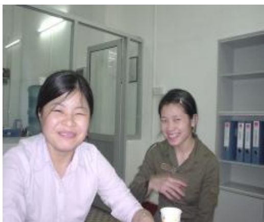
工友们快乐的笑脸