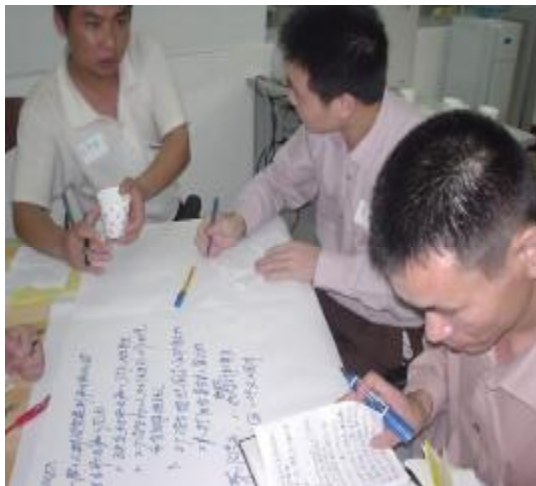
快乐中的思考——工友小组讨论