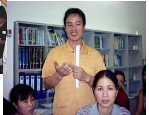
工友胸有成竹的回答职安健问