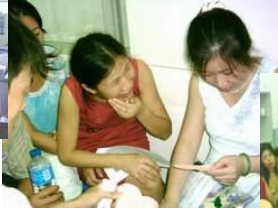
大家齐心协力努力的猜! 有丰富的奖品等着拿。