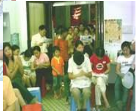
这里那么的热闹,社区的人都挤进来了!