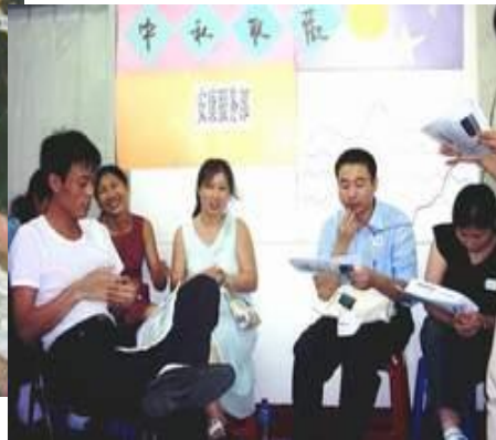
大家尽情的唱吧!传达思乡情!