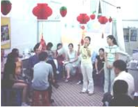
红灯笼高挂,工友欢快!

当天举行了好玩的游戏、有趣的有奖猜灯谜和在轻松快乐的活动中学习职业安全方面的知识。工伤病友也有他们自己的快乐,你看这些照片。