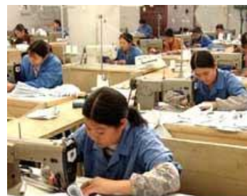
超时劳动撑起女工“高薪”假象

住院期间，我的家人前来看护我，还向老板的亲戚追钱，不然我没办法继续住院治疗了。可是，厂里欠我的 4000 多块钱工资没有还给我，而是被老板充作医药费。我的手术、医药费由当地政府垫付了一部分。现已欠药费，医院停止用药了。