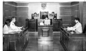
广东劳动仲裁案不断上升