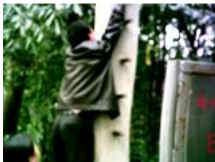
瞧！我能爬得有多高！