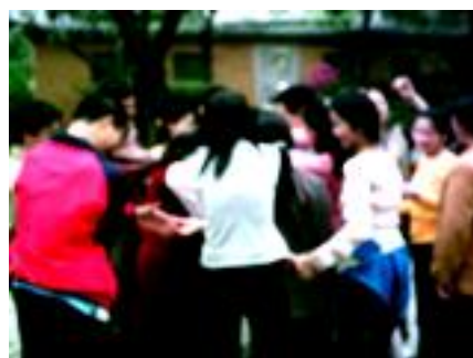
解人结，解开烦恼的结