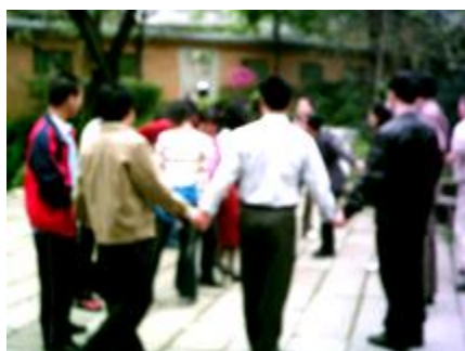
齐心协力，没有解不开的结