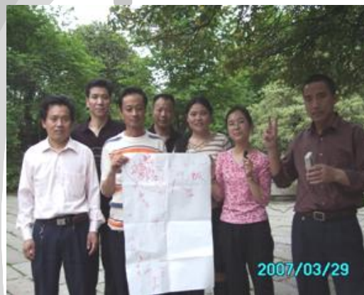
耶！我们组的解释很完美。胜利！