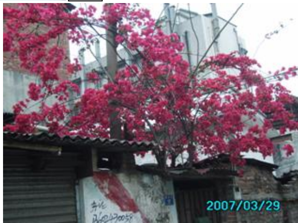
开得灿烂的红花也比不上工友活动的热闹。