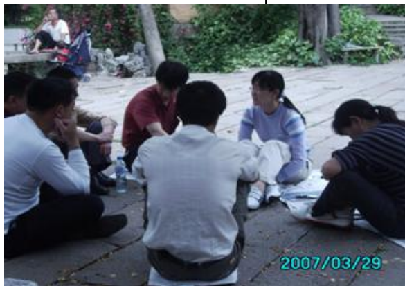
小组讨论：看起来有点严肃~~~