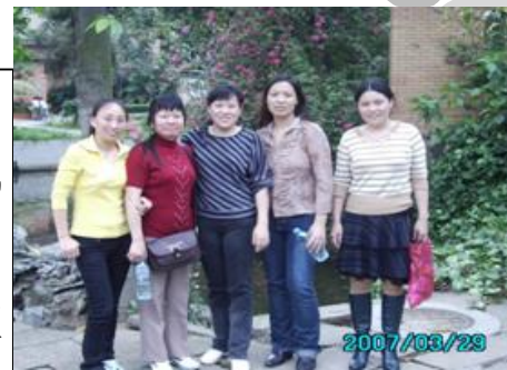
五朵花，一年难得一次的留念。