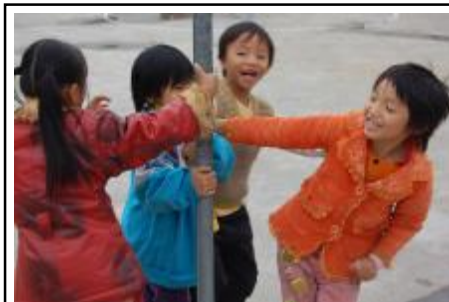
农村来的孩子，城市里的房子。

世界是不是太小 不然我怎会 拐来拐去还在原地 也不用许愿了吧 都没有流星雨 让你看 有八岁的小孩 在破了好多个洞的教室里 捉迷藏