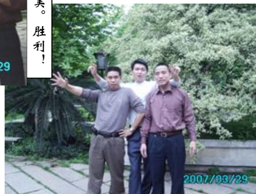
笑得开怀的三兄弟！