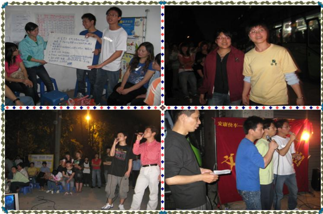
安康快车文艺队聚会