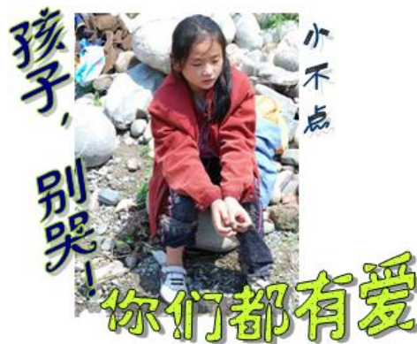
——献给四川汶川大地震中的孩子

该死的地震, 让你们失去了爱你们的亲人。 可是,不要怕,孩子们, 你们没有失去一切, 你们一样有家, 一样有爸爸和妈妈, 一样拥有你们的爱,