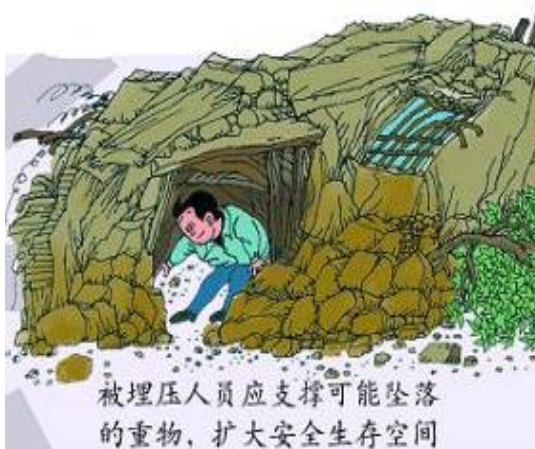
被埋压人员应支撑可能坠落的重物，扩大安全生存空间