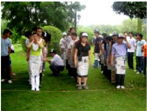
围裙比赛 就要开始啦! ——

2008年5月的第一天,以及5月中,工友们又聚到了一起,举行活动。在绿树成荫的公园里面,我们欢欢乐乐地聚会,畅畅快快地呼吸那新鲜空气。我们也进行了有点严肃的讨论——想想看,我们这些小鱼能怎么办?