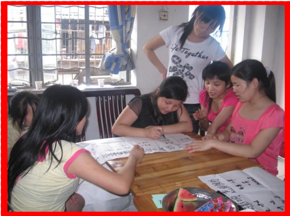
2008年8月义工培训：工伤预防