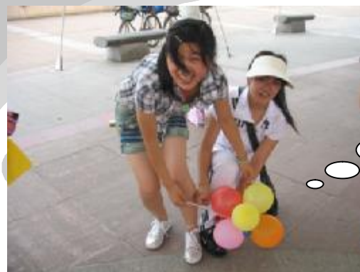
“好玩吗?” “嗯,好玩……可是,也紧张呀~”