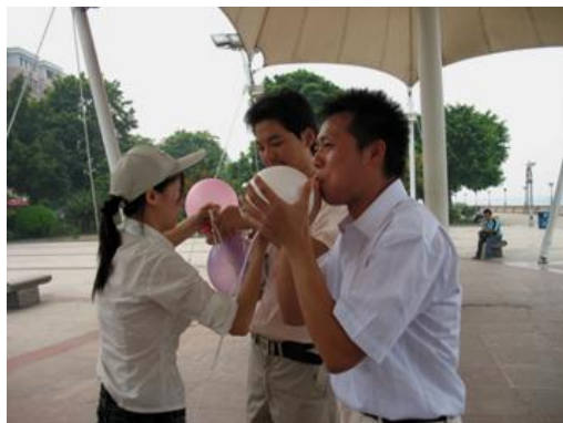
踩汽球游戏就要开始啦! 快点准备哦~