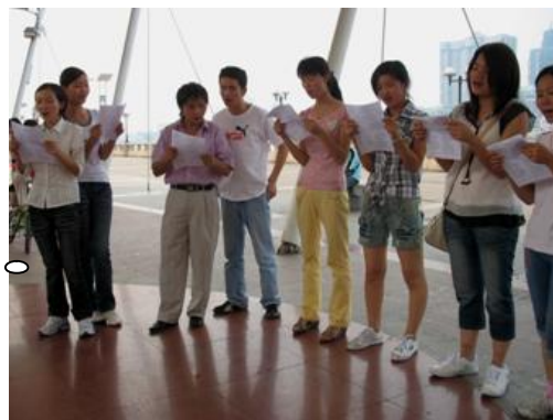
工人之歌—— 我们唱自己的歌~