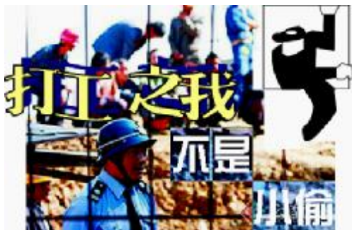
◇ 青松 ◇

这是我到北京的第三个月。一个刚刚毕业的大专生，在人生地不熟的繁华都市，说是先求生存，再求发展，但要开辟自己的天地谈何容易！这是个人才济济的地方，这是个遍地大学生的城市。即便是个小小的职员也要面对几十人的竞争，企业更是在这几十人里寻找精英中的精英。在这个机遇遍地的城市里，拿不出手的大专生真的寸步难行。