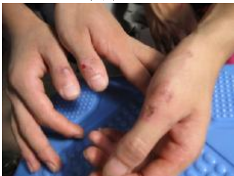
~鞋厂工友：伤痕累累的手~