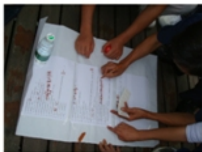
群策群力——世上无难题