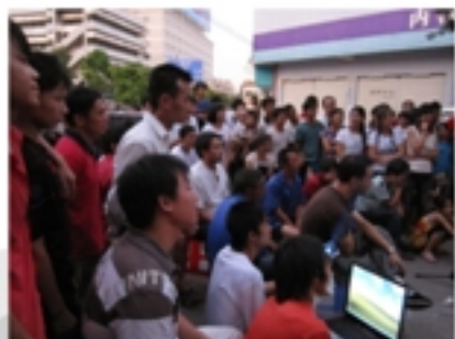
不用说，工友们的演出 一定精彩极了！