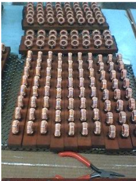
^_^出自我们之手的产物^_^