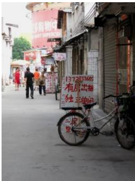
<<< 路边的黑中介 <<<