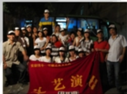
文艺队工友群英会