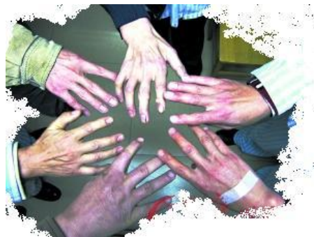
上图:打磨工人的指关节已经变形

报导较少的职业病“浮出水面”。事实上振动作业分布的行业很广。不少工友患上相关职业病。因此,从事振动作业的工友应当特别注意。