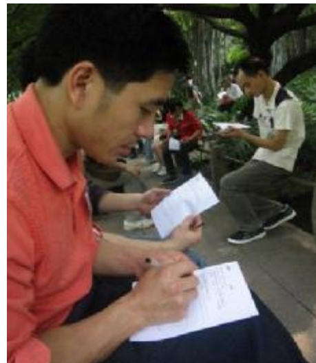
<<< 简单说说你的想法 <<<