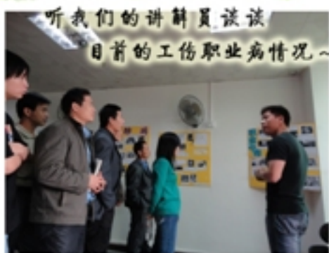
听我们的讲解员谈谈 目前的工伤职业病情况~