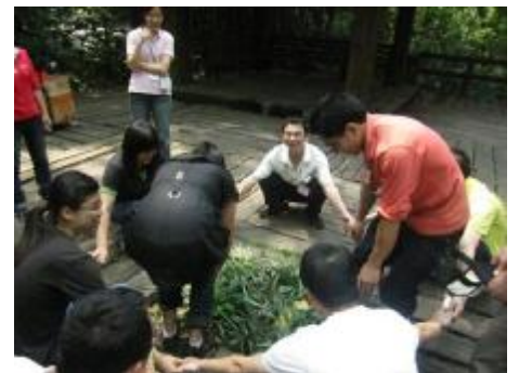
▲ 表演童年的故事——捉鱼