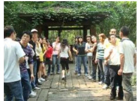
△ 在“你拍我叫，相互认识”和“大风吹”之后，又一个团队游戏——钥匙扣接力赛