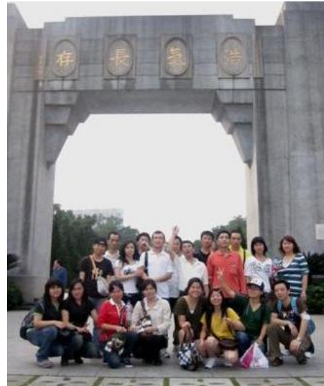
^_^ 不可少的全家福 ^_^