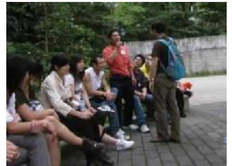
~真我的风采：拉歌——与数字有关的歌都行，考的就是记性~