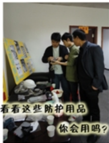
看看这些防护用品