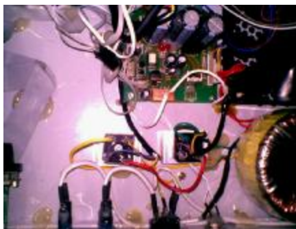
<<< 线板.....乱乎? 乱中有序 <<<