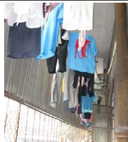
<<< 我们的衣服——工农 <<<