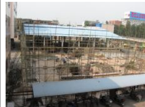
>>>工友的游乐场如今要建高楼>>>