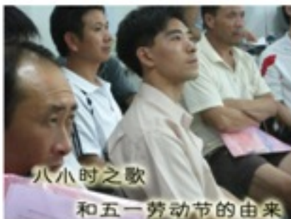
八小时之歌 和五一劳动节的由来