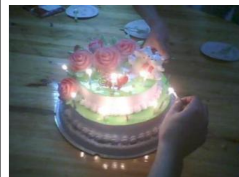
<<< 生日快乐哦 <<< △