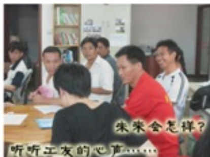
未来会怎样? 听听工友的心声……