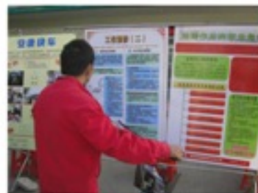
图文并茂的快车道健康知识 展板，吸引了不少工友哦~