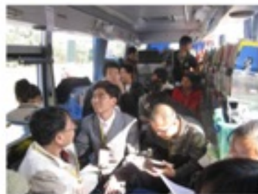
出发前，讨论当天的流程