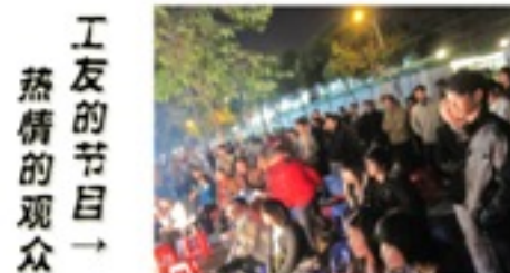
工友们的节目→ 热情的观众