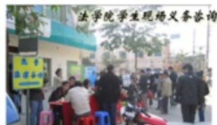
法学院学生现场义务咨询