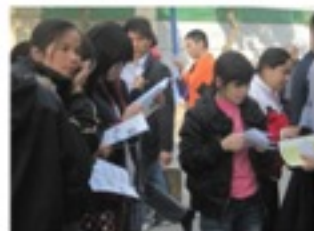
← 工友们在 阅读宣传单张