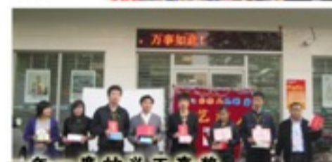
一年一度的义工嘉奖 快车道大家一起成长