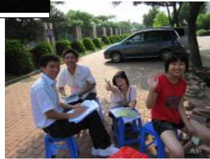
主持人的台词, 靠你们啦~