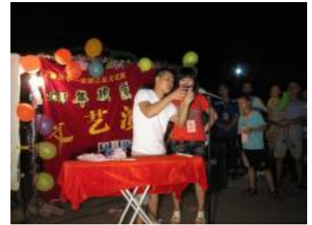
“看仔细, 看, 看……不见了!”