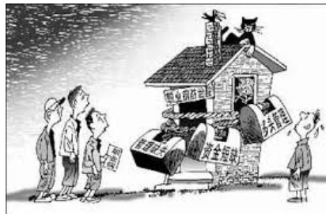
——积极行动与消极等待的差别