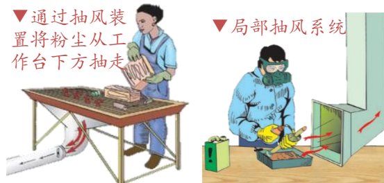
▼通过抽风装置将粉尘从工作下方抽走